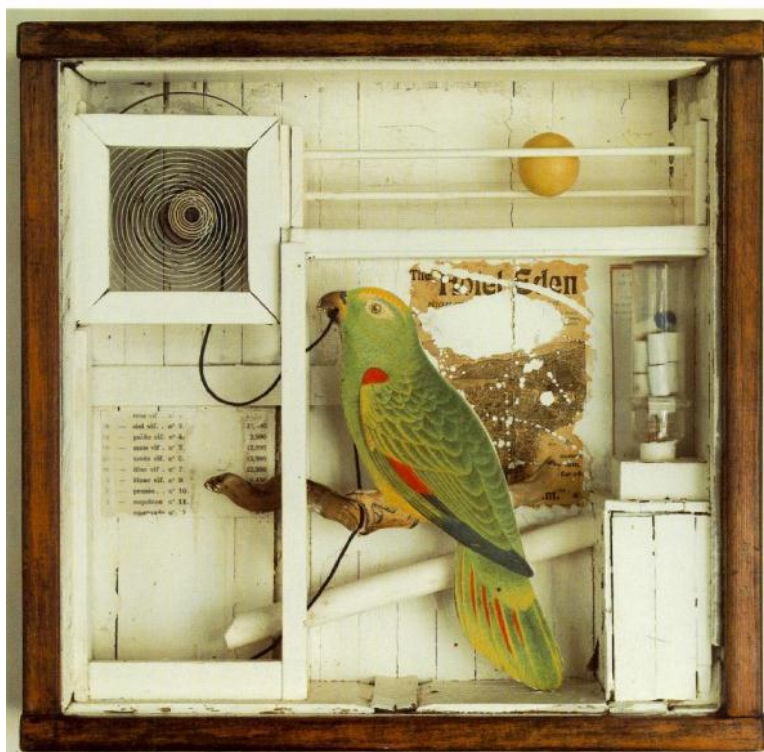
Το ξενοδοχείο Εδέμ, Τζόζεφ Κορνέλ