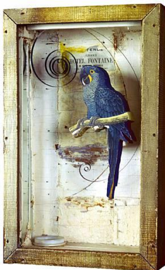
Οι άγγελοι του Kivi, Τζόζεφ Κορνέλ