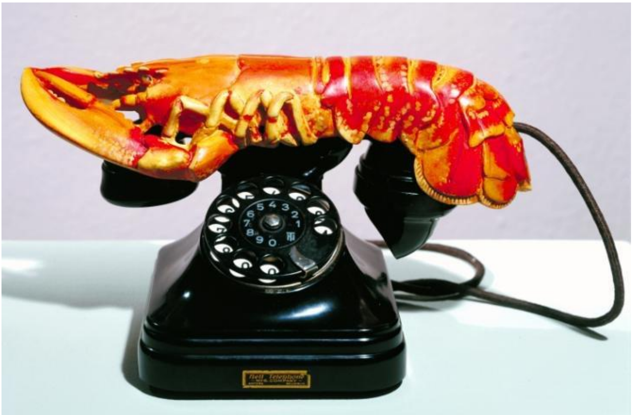
«Τηλέφωνο Αστακός», Salvador Dalí / Φωτογραφία

Και μην ξεχνάς: Όλες οι απαντήσεις είναι σωστές!!!!