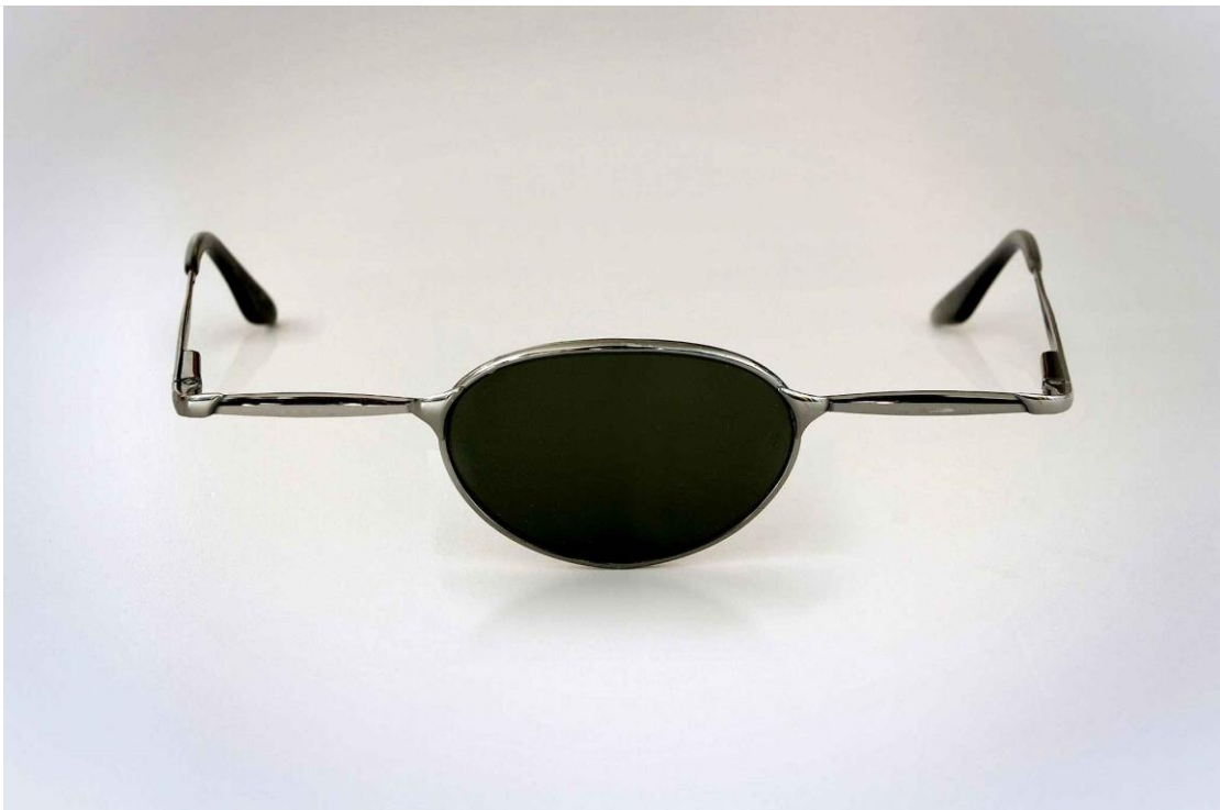
«Απίστευτο, αλλά όχι αδύνατο», Giuseppe Colarusso / Σειρά ψηφιακά επεξεργασμένων φωτογραφιών