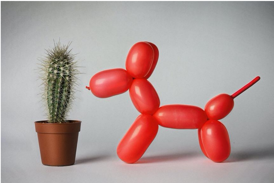
«Απίστευτο, αλλά όχι αδύνατο», Giuseppe Colarusso / Σειρά ψηφιακά επεξεργασμένων φωτογραφιών