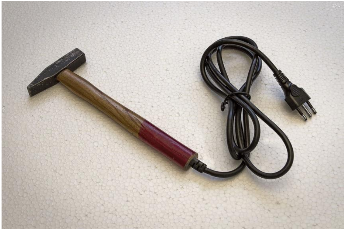
«Απίστευτο, αλλά όχι αδύνατο», Giuseppe Colarusso / Σειρά ψηφιακά επεξεργασμένων φωτογραφιών